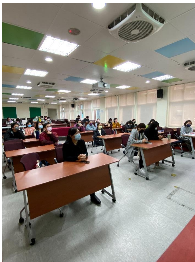
臺北市信義區雙永國民小學 111 學年度第 2 次校務會議照片